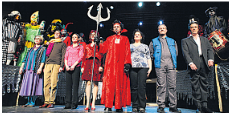
Das Charivari wurde vom Teufel geritten.

ka, der eigens für das Charivari gebildeten Clique Storzenääri, der Pfyfferegrubbe Schäärede und der Gugge Mohrekoepf. Begeistert haben auch die jungen Artistiktambouren der Gruppe Aprico und mit Ciaccolo ein so genannter Beatboxer. Darunter versteht man einen Oralakrobatiker, der mit seinem Mund Schlagzeug- und andere Rhyt-