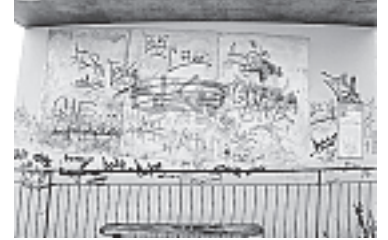
Nicht jedes Geschmiere ist Kunst, bebildertes Beispiel dokumentiert einen Vandalenakt - aufgenommen an der Haltestelle Hechtliacker - und somit eine Straftat.