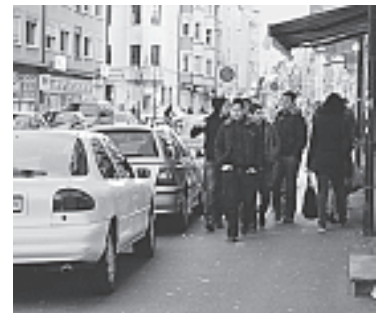
... verzeigt werden! - Aber unsere Behörden versagen auf der ganzen Linie...

für die anliegenden Geschäfte ohne Behinderung des Tramverkehrs sichergestellt werden muss.» Die schreibt die Regierung in ihrer kürzlichen Beschlussbegründung auf eine schriftliche Anfrage von Grossrat Ernst Jost (SP) zur Situation