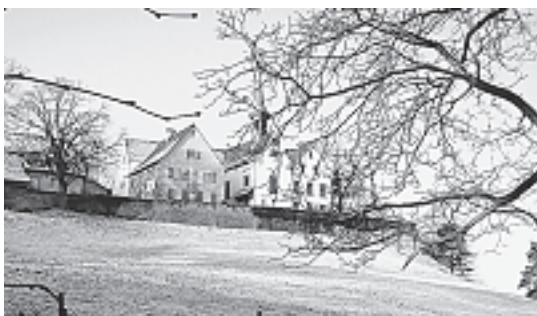
Winterliche Stimmung beim Margarethenkirchlein

Es hat ja schon im November geschnitten, da war gerade Zeit, im Garten Ordnung zu machen: die Astern und all die andern Spätblüher zurückzuschneiden, die kälteempfindlichen Exoten mangels Orangerie in die Waschküche zu verstauen... Winterschnitt heisst Rückzug auf den Kern des Lebens, heisst aufräumen und Platz schaffen für das Künftige. Es heisst auch, besinnen auf das Wesentliche. Der November mit Allerheiligen und Allerseelen ist ja der besinnliche «Friedhofsmonat», gewiss grau-neglig trübe, ja traurig, aber auch tröstlich. Ebenso ist er die «stubige» Zeit, in der man sich nach Wärme, Geborgenheit und «Ofenbänkli-Geselligkeit» sehnt, oder man schätzt dann wieder einen Abend mit Hausmusik, ein schönes Buch ...oder einen Metzgete-Abend in einer gemütlichen Gaststube. Man ist auch eher dazu gestimmt, Besuche bei Kranken, Einsamen, Vergessenen zu machen, oder seinen aufgestauten Alltagskram zu ordnen, «auszumisten» im Blick auf die Zukunft. So wäre man innerlich für Weihnachten gerüstet, zum Zusammensein in der Familie, bei Freunden und Mitmenschen unter