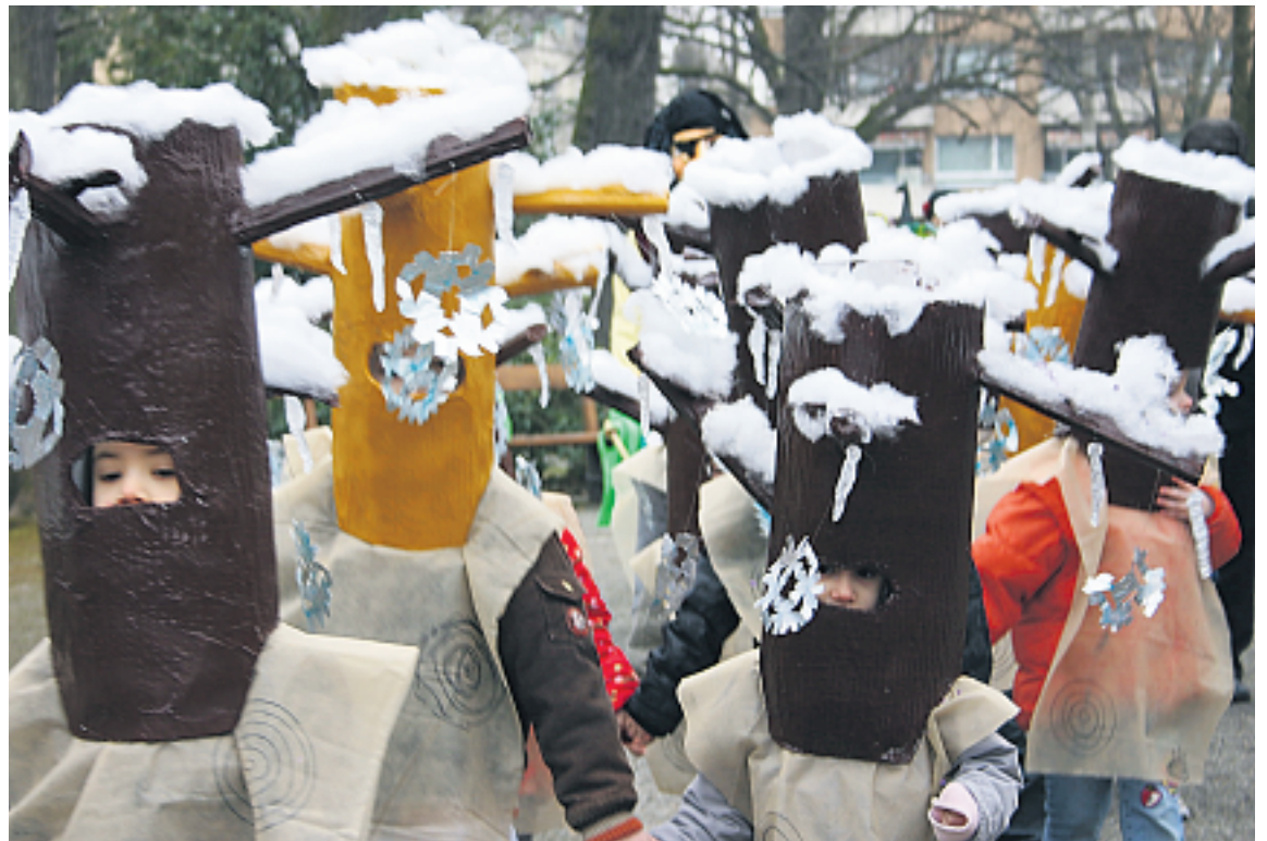
Bezaubernde Kindergartentfasnacht im Gundeli, rund um den Winkelriedplatz. Diese Kinder haben ein passendes Sujet zur aktuellen Wetterlage gewählt. Mehr zur Kinderfasnacht, zur Basler Vorfasnacht und - Fasnacht erfahren Sie auf den Seiten: 9-13 und 21 in dieser Ausgabe. «Mir winsche e scheeni Fasnacht!» Foto: GZ.