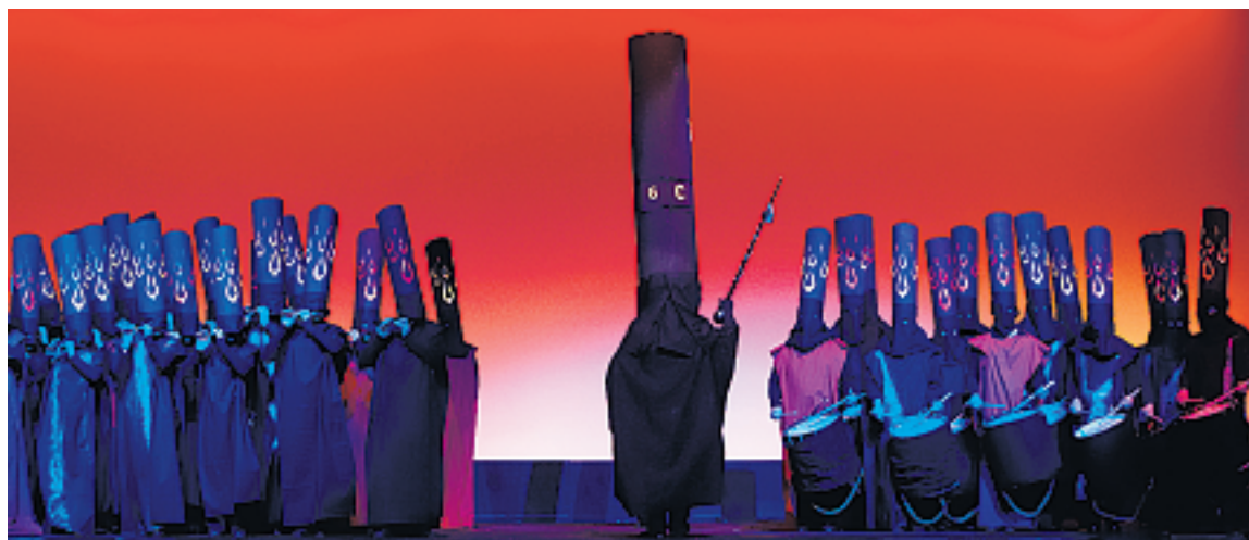
«Feuriger» Auftritt der Fasnachtsgesellschaft Gundeli am Drummeli 2009.