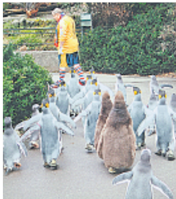
Im Bild festgehalten: Die Pfeifergruppe The Pinguinos mit Basels «erschtem arbeitslose Tambourmajor» – dem Joggeli – anlässlich ihrer ersten Marschübung. Ubrigens, Joggeli ist der grosse Pinguin vorne in der Mitte.