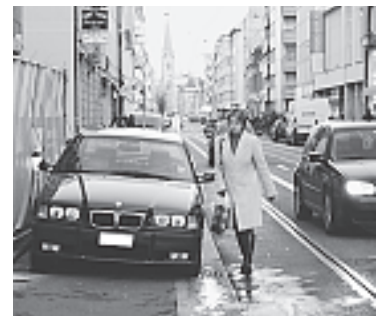
Diese kriminellen «Wildparkierer» sollten sofort abgeschleppt und...

Bau- und Verkehrsdepartement prüft deshalb, zusammen mit der Abteilung Verkehr der Kantonspolizei, ob mit zusätzlichen baulichen Massnahmen und einer noch deutlicheren Signalisation dem illegalen Parkieren auf dem Trottoir entgegen gewirkt werden kann. Dabei muss aber immer berücksichtigt werden, dass der Güterumschlag