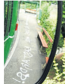
Vandalismus am Jakobsberg....