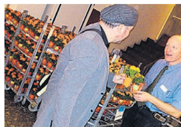
Kleine Geschenke erhalten die Freundschaft – oder die Kundschaft. Buntes Blumentopf-Präsent in der Migros – hier im Gundelitor.

chen und Sonstiges. Im Migros Gundelitor – aber nicht nur hier – wurde die Kundschaft mit einem kleinen blumigen Präsent überrascht, getreu dem Motto: Kleine Geschenke erhalten die Freundschaft – oder die Kundschaft. Die im frischen M-Orange gehaltenen Blumentöpfchen, sorgen in mancher Stube für den nötigen Farbtupfer.