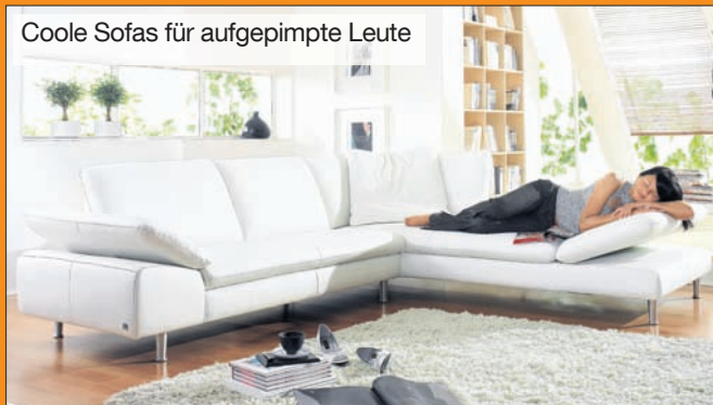
Traumhaftes Ambiente – mit Sofas von den Machalke Polsterwerkstätten ...