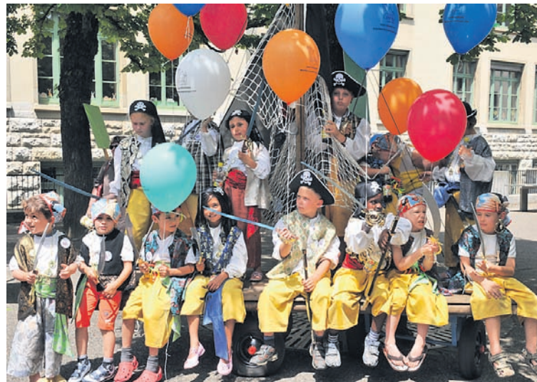
Die Piraten waren der grosse Renner am diesjährigen Gundeli-Feschcht'09/Jugendfest. Mehr dazu auf dieser Seite mit Fortsetzung auf den Seiten 8+9.