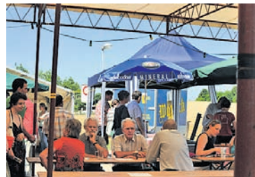
Schnappschuss von der Klosterfiechten-Chilbi'09.

chen und Sonstiges. Im Migros Gundelitor – aber nicht nur hier – wurde die Kundschaft mit einem kleinen blumigen Präsent überrascht, getreu dem Motto: Kleine Geschenke erhalten die Freundschaft – oder die Kundschaft. Die im frischen M-Orange gehaltenen Blumentöpfchen, sorgen in mancher Stube für den nötigen Farbtupfer.