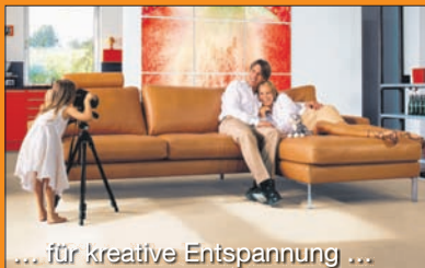
... zum Wohlfühlen designt.