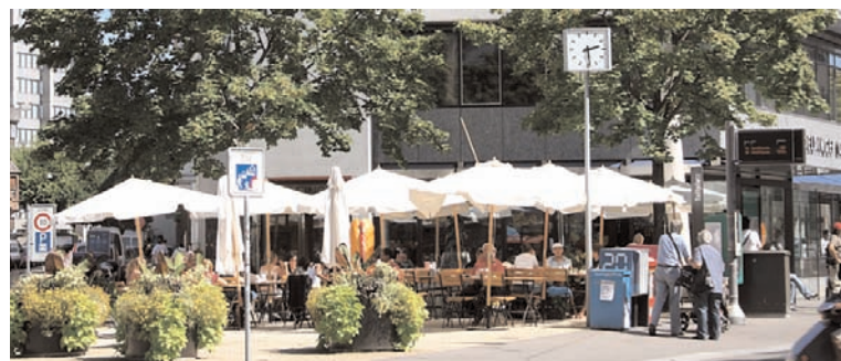
Dank der neuen, attraktiven Möblierung des neuen Kaffi Sandwich wirkt jetzt der Tellplatz noch schöner und gediegener.

platz. Innerhalb des Kaffi Sandwich ist bereits ein Fumoir im Bau. Das Restaurant bietet Platz für bis zu 100 Personen. Dazu kommen noch die ca. 70 Plätze auf der Gartenterrasse; seitlich an der Güterstrasse, bei der Tramhaltestelle, sind weitere 30 Plätze vorgesehen. Das Kaffi Sandwich ist eigentlich nicht neu im Gundeli; es besteht dort seit 5 Jahren eine Filiale. Weitere Filialen gibt es seit 12 Jahren in der Aeschenvorstadt und seit 5 Jahren am Wettsteinplatz. Das beliebte Angebot des Kaffi Sandwich besteht, wie es bereits der Name sagt, aus einem reichhaltigen Angebot an Sandwiches. Daneben gibt es aber auch Fleischgerichte, Pizze, Salate, Pasta aus einer gutbürgerlichen Küche. Das Kaffi Sandwich ist auch Spezialist für Catering und Party-Service jeglicher Art, sei es für Geburtstage, Jubiläen, Hochzeiten. Durchgeführt werden beispielsweise auch Sandwichlieferungen inkl. Getränke und Kaffee für Sitzungsteilnehmer einer Firma. Fragen Sie das Team des Kaffi Sandwich unverbindlich nach einem passenden Angebot. Das Kaffi Sandwich hat täglich geöffnet, auch an Sonn- und Feiertagen: Mo-Fr von 06-24 Uhr, Sa und So von 8-24 Uhr. Es kann von 06 Uhr morgens bis um 24 Uhr durchgehend gegessen werden. Für Auskünfte/Bestellungen: Telefon 061 361 55 02 oder 061 361 55 03, im Internet unter www.kaffi-sandwich.ch . ■