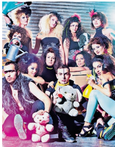
Die Gastgeber: Showgruppe Different

Eine Brücke schlagen zwischen dem Musical-Genre und der zeitgenössischen Hip-Hop-Kultur: dieses Ziel verfolgt die bisher grösste Produktion des New Dance Center im Gundeli Basel.