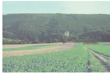
Der Schweizer Blauen von Norden gesehen.

Haben Sie es am Fernsehen auch mitbekommen, was die Schönheits-Stars der Schweiz gewusst (oder besser: nicht gewusst haben) von unserem Land? Für das Leben muss man natürlich viel mehr wissen, als z.B. das Matterhorn kennen. Meine Schüler (ich war lange Zeit Geographielehrer) mussten bei mir immer wieder wichtige Gebäude und Landschaften der Schweiz, Europas und der ganzen Welt «lernen». Zu Beginn der Stunde zeigte und erklärte ich diese jeweils im