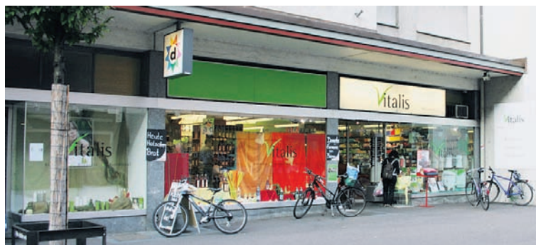
Vitalis Bioladen und Drogerie AG an der Güterstrasse 203 beim Tellplatz ist Ihr Fachgeschäft für Echt Bio- und Demeter-Produkte.

Auch diesen Herbst wieder läuft bei Vitalis eine Bio-Aktion. Informieren Sie sich bei Vitalis über das umfassende Bio-Sortiment mit den günstigen Monats-Angeboten. Monica und Gilbert Laissue-Lüthi sowie das sympathische Vitalis-Team stehen für kompetente Beratungen zur Verfügung. Die Aktionsprodukte sind direkt beim Eingang des Ladens platziert. Vitalis als Echt Bio- und Demeter-Fachgeschäft steht hundertpro-