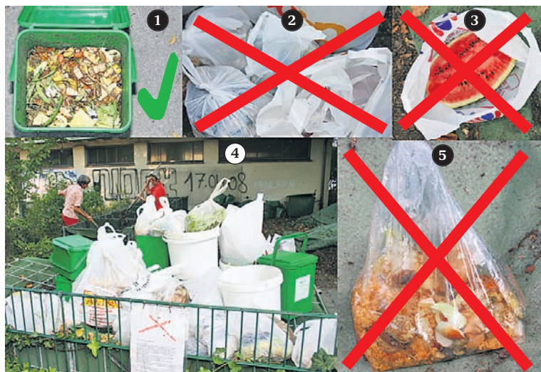
1) Erwünscht wird die Anlieferung von organischen Rüstabfällen (zerkleinert) in den allbekannten grünen Kompostkübeln (mit Ihrem Namen angeschrieben). 2) Keine Plasticksäcke! 3) Bitte zerkleinern und in einem Kübel abgeben. 4) So sieht es

Kompostkübel können Sie auch mit Ihrem Namen versehen) wenn möglich während der Öffnungszeiten (siehe unten) oder zumindest ein Abstellen des zu verarbeitenden Rüstgutes am selben Tag. Für das Gundeli ist es wichtig, dass diese vor 18 Jahren in Betrieb genommene und das ganze Jahr geöffnete Kompostierungsanlage weiterhin erhalten bleibt. Die Öffnungszeiten gelten weiterhin unverändert: Jeden Dienstag (17 bis 17.30 Uhr) und Samstag (10 bis 11 Uhr). Wer sich allenfalls für Helferarbeiten im Kompostierteam interessiert, der ist jederzeit willkommen. Interessierte können während den Öffnungszeiten vorbeigehen, oder sich telefonisch bei Vreni Schär (061 361 14 26), melden. ■