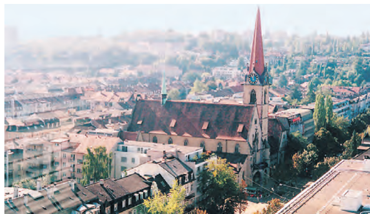
Es fällt auf, dass die Stimmbeteiligung der Damen und Herren der Basler Grossräte dürrig bis miserabel ist, wenn über Geschäfte zu bestimmen ist, die das Gundeli-Bruderholz betreffen! Im Bild das Gundeli-Bruderholz mit seiner Heiliggeist-Kirche Blickrichtung Süden.