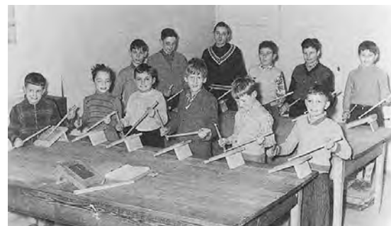
Blick in die Trommelstunde der Gundeli-Clique (Junge Garde) im Keller des Thiersteinerschulhauses (1939).

Einfache Streiche wie Dupfe, Schlepp oder der Mama-Papa-Wirbel waren bald intus, aber die zusammengesetzten Fünfer- und Neuner- und die End-Streiche erforder-