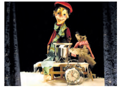
Vorfasnacht im Gundeli: Kaspers Morgenstraich (siehe S. 9).

Riesenandrang auf die schönen Sondermarken zum Comité-Jubiläum. Fast im Nu waren diese Briefmarken weg. Und bei den Plaketten fanden die Uelis eine rege Nachfrage. Etwas anders gestaltet sich der Drummeli-Billetverkauf. Aber gut, die Konkurrenz ist natürlich nicht ohne. Zum Monstre Trommel-Konzert – kurz Drummeli – gibt's ja auch noch das Fasnachtsbändeli , das Fasnachtskiechli , das Kinder-Charivari , das Mimösli , das Pfyfferli , das Ridicule , der Ufftaggt , die Wirrlerte , die Zauberladääarne , das Zofinger Konzärtli , s Offizielle und im