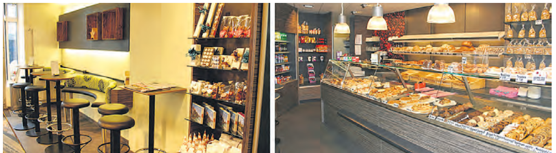
Neu im Gundeli: Bäckerei-Konditorei Kübler - ein Familienbetrieb - Güterstrasse 126. Links die gemütliche Stehbar, rechts das stets frische und reichhaltige Kübler-Angebot.

Für Auskünfte oder Bestellungen: Telefon 061 361 04 06. Öffnungszeiten: Mo-Fr von 6-18.30 Uhr, Sa von 7-16 Uhr und So von 8-13 Uhr. ■