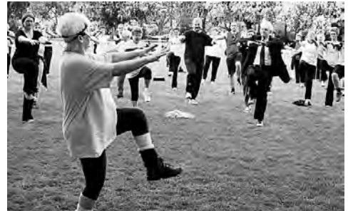
Gsünder Basel hält Sie fit – auch im Margarethenpark. Foto: «Gruppe Vreni» vom letzten Jahr.

Gsünder Basel – mit Sitz im Gundeli (Güterstrasse 141) feierte seinen zwanzigsten Geburtstag stilgerecht mit dem Saisonstart der Gratis-Bewegungsaktion «Aktiv! im Sommer». Der Nonprofit-Verein motiviert jedes Jahr rund 2'500 Einwohner unserer Region, sich für die eigene Gesundheit einzusetzen.