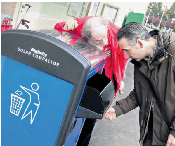
Spannend, dieser neue solarbetriebene Müllkompaktor, der u.a. probeweise auch an der Tramendstation Bruderholz aufgestellt ist.

kompaktor. Und wie der Name ver-rät, wird beim Einwurf der Abfall gepresst. So braucht dieser nicht nur weniger Platz – also der Abfall, die Stadtreinigung muss weniger lee-