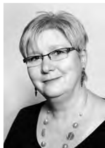
Jenny Ch. Wüst, Präsidentin CVP-Frauen Basel-Stadt.