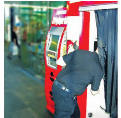
«Mister X» konnte verhaftet werden... - Das nachgestellte Foto von Martin Graf zeigt lediglich den Tatort, die abgebildete Person ist nicht «Mister X».

Diese Geschichte lesen Sie hier in der GZ exklusiv; bevor sie im «Blick» oder gar in einer Zürcher Zeitung oder im Ausland auf Umwegen doch noch erscheinen sollte. Ich habe sie nicht «live» erlebt, sondern absolut verlässlich aus erster Hand erfahren.