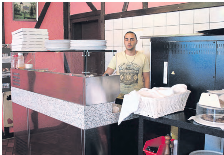
Neu im Restaurant Dreispitz: Pizza-Station samt Ofen und Pizzaiolo für eine frische Zubereitung im Restaurant selber.

GZ. Die feinen Pizze – zur Auswahl stehen über 20 verschiedene Sorten von Margherita, Napoli, Calzone, Diavolo über Quatro Stagioni bis Pizza «Dreispitz» – werden direkt im Restaurant selber von einem Pizzaiolo frisch zubereitet. Sie können also dabei zusehen. Dazu hat die Familie Yüksel im vorderen Restaurantteil eine Pizza-Küche samt Ofen eingebaut (siehe Foto). Alle Pizze können Sie auch für nur Fr. 14.– pro Pizza (Mitnahmepreis für alle Sorten) mitnehmen!